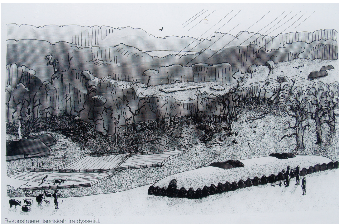
Rekonstrueret landskab fra dyssetid.

Urørte kamre. Det er usædvanligt at finde dyssekamre der ikke har været rørt siden de blev opført. Som regel er kamrene genbrugt flere gange - ikke blot senere i stenalderen, men også i de følgende af oldtidens perioder.