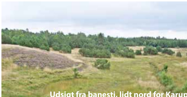
Udsigt fra banesti, lidt nord for Karup

15. Kølvrå blev påbegyndt i begyndelsen af 1950'erne, og var i 1950'erne primært beboet af flyvestationens personel og deres familier. Kølvrå er opført efter moderne byplan (byen er anlagt med T-kryds og det første firkantede kryds blev anlagt i begyndelsen af 1970'erne). Ved Fyrrevej drejer du til venstre og følger grusvejen til Gedhus.