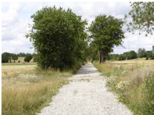
Banesti syd for Øster Bording

øst for Hinge Sø. Alling Å løber til Gudenåen.