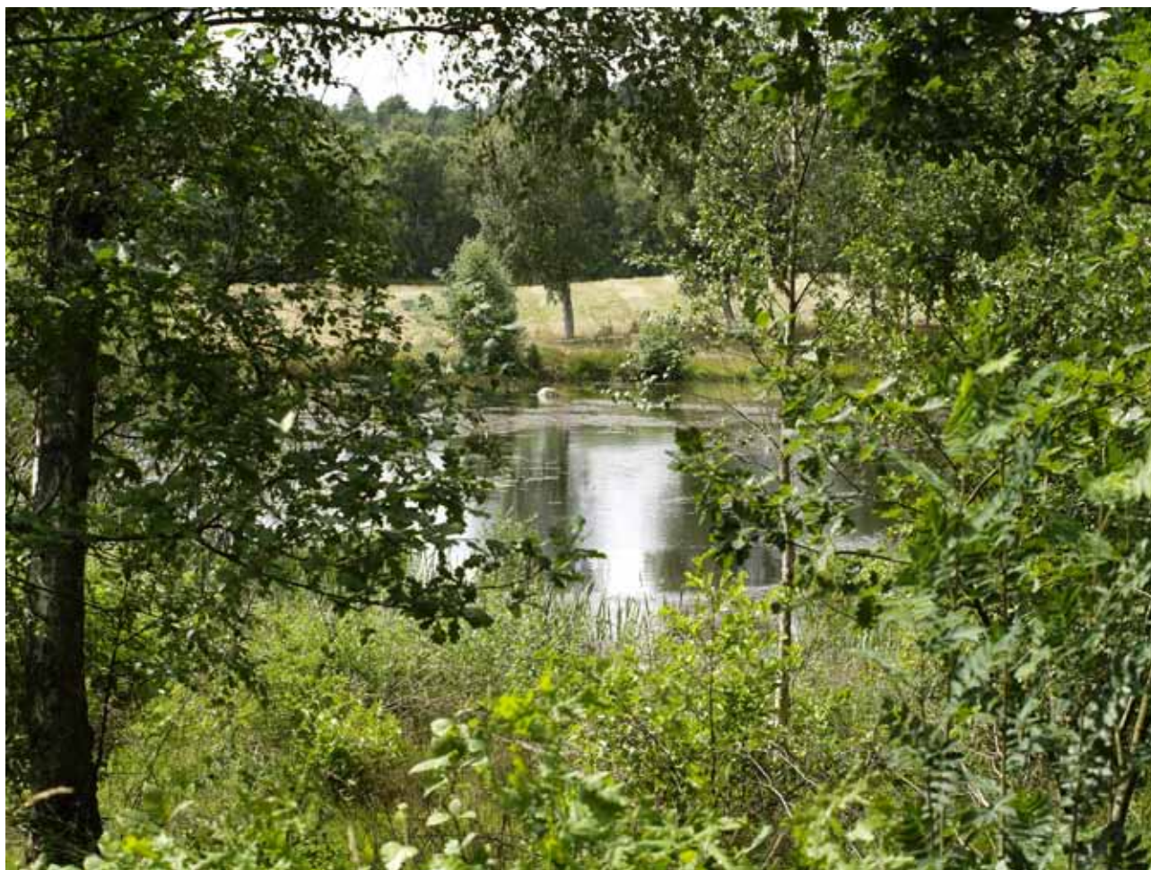
Sø vest for stien, nord for Silkeborg