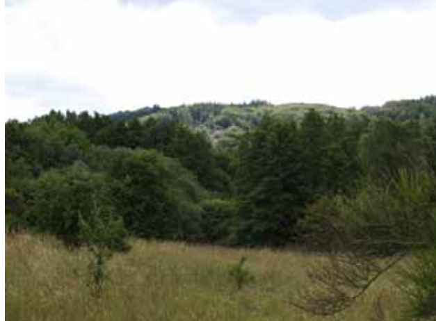
Udsigt fra gangstien mod vest til Funder bakker

Stien går gennem det nordvestlige del af søhøjlandet ved Silkeborg mod det mere flade morænelandskab mod nord. Lidt nord for Silkeborg ses bakkelandskabet, hvor der er en meget smuk natur, og hvor Silkeborgs borgere får deres drikkevand - se efterfølgende afskrift af planche.Der ses mange smukke dalstrøg, hvor afvanding fra sidste istid forløb.Omkring Øster Bording ses det flade morænelandskab. Fra Skæggkær følger banestien Lemming Å. På denne del er banestien meget smuk. med