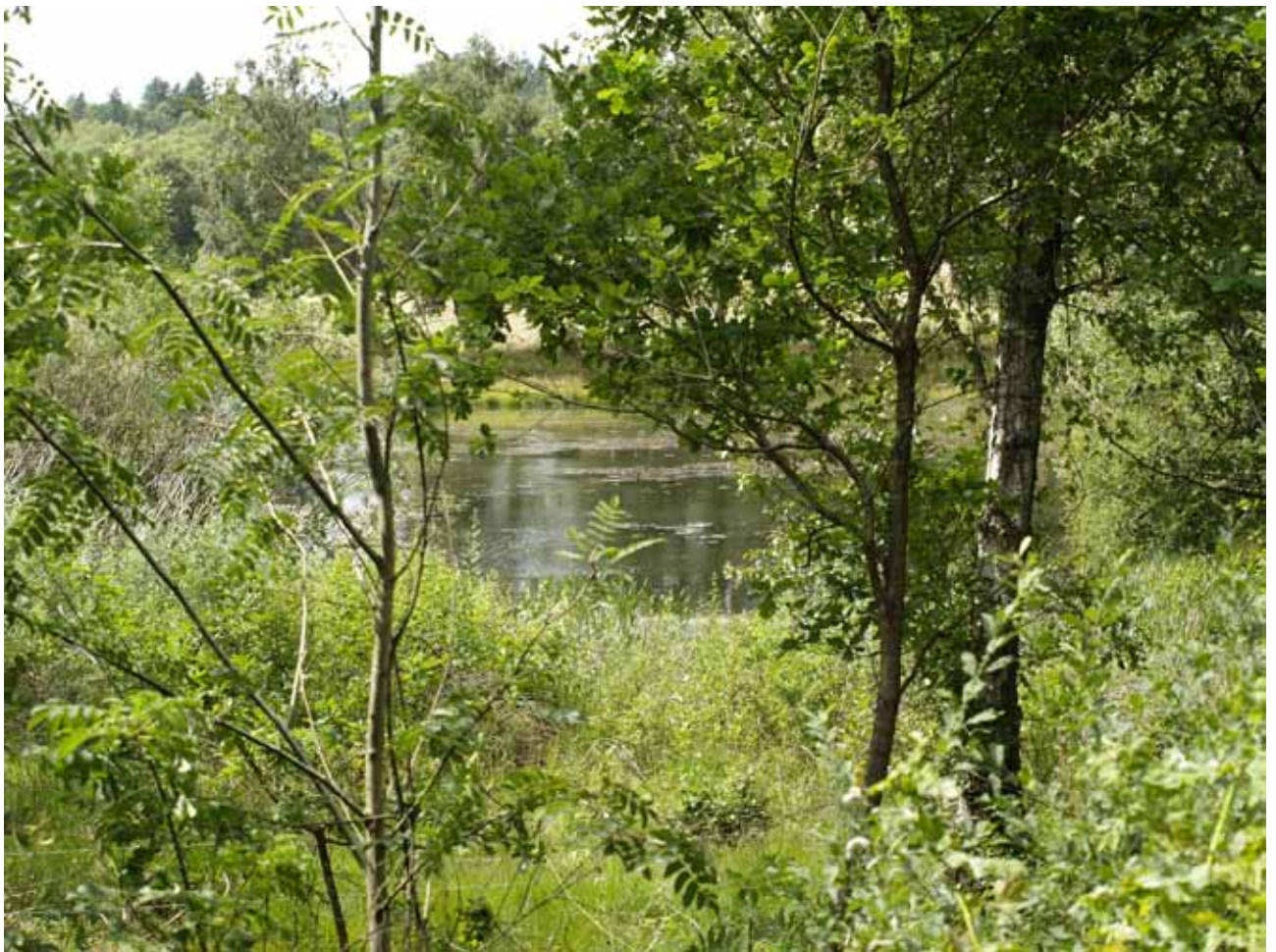
Sø vest for stien, nord for Silkeborg