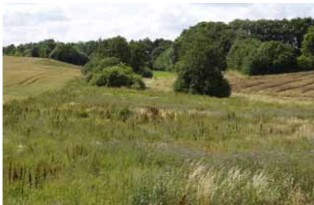
Udsigt over Lemming Å syd for Skægkær

I skrivende stund (2010) er der undersøgelser om stiens forlængelse til Kjellerup.