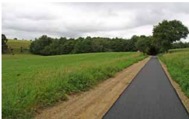
Landskab nord for Skægkær