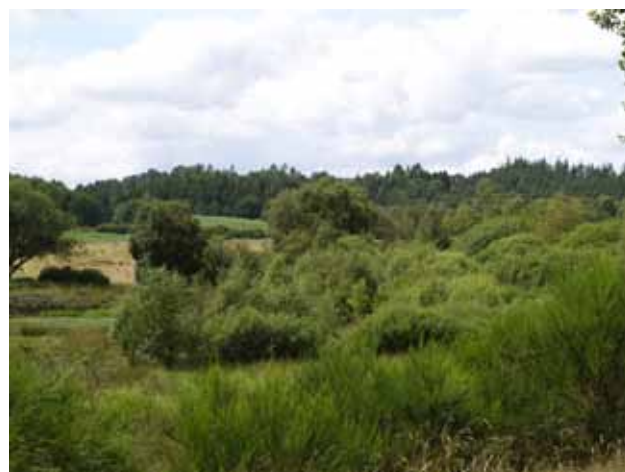
Udsigt mod vest over Hvinning Dal

fuglesang og klukkende vandløb og stien slutter ca. 4 km efter Skæggkær, hvor det bakkede landskab igen ses.