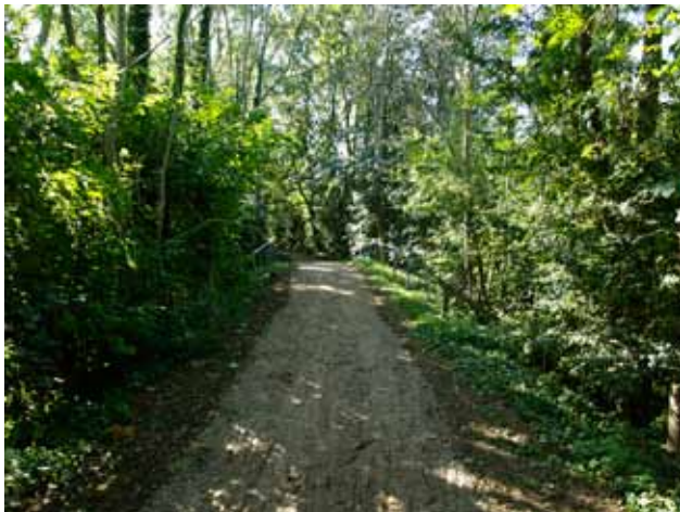
Banesti over bro - se nedenstående billede