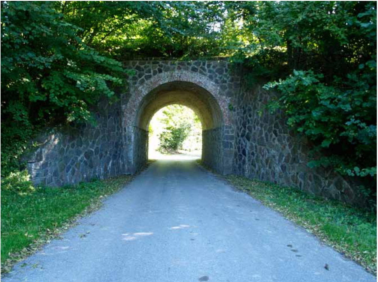
Meget smuk bro under banestien. Der er en trappe fra banestien til vejen, så det er let at se den smukke bro