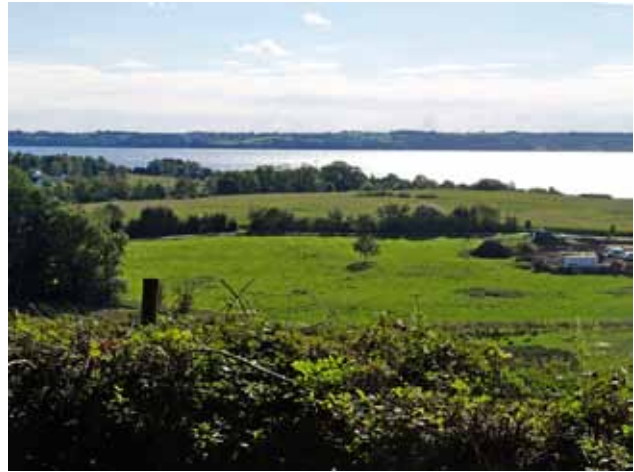
Udsigt fra banestien over Aabenraa Fjord