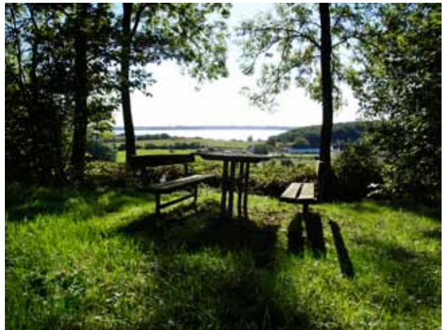
Udsigter fra rastepads ved banestien.