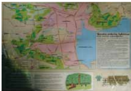
Planche om „Jørgensgård Skov“