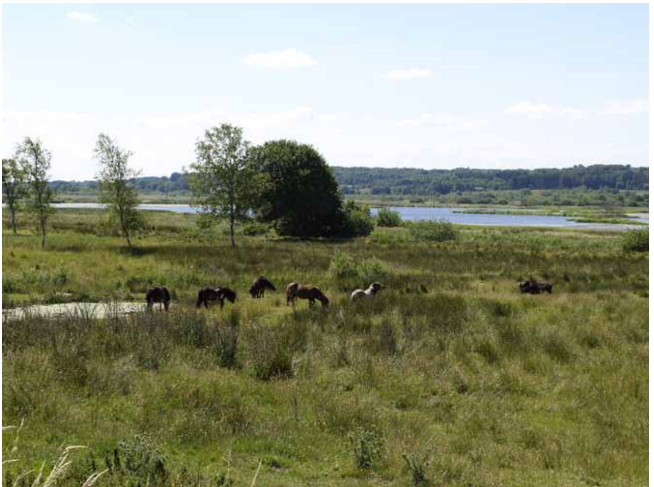
Halkær sø - set fra naturlejrplads (med shelters) ved Halkær. Få meter fra banesti Års - Nibe

Se også andre banestier på www.lgbertelsen.dk/cykelture/banestier.pdf