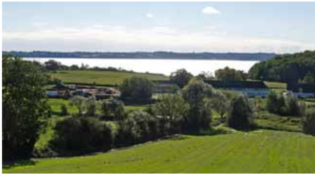
Smukt beliggende efterskole

bygninger. Så en tur i Aabenraa's gamle bydel kan varmt anbefales.