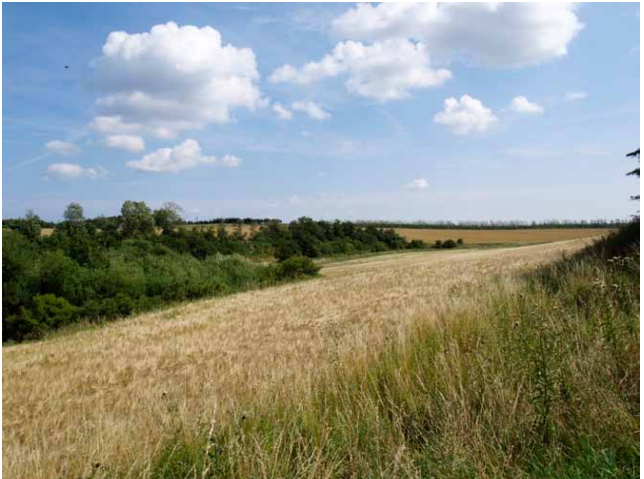
Mølleådalen sydøst for Fjerretslev