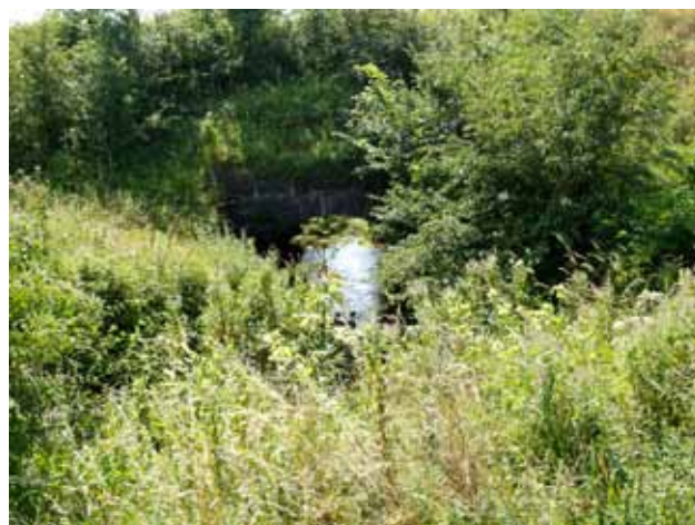
Banestien krydser Mølleåen ved Fjerritslev

Byerne er vokset op omkring jernbanen, men i