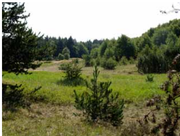
Landskab øst for Bonderup

Der er opdyrkede „indsøer“ (fra istiden), med et meget smukt landskabsbillede og der er smukke dalstrøg i naturlandskabet - ses tydeligt lige øst for Bonderup.