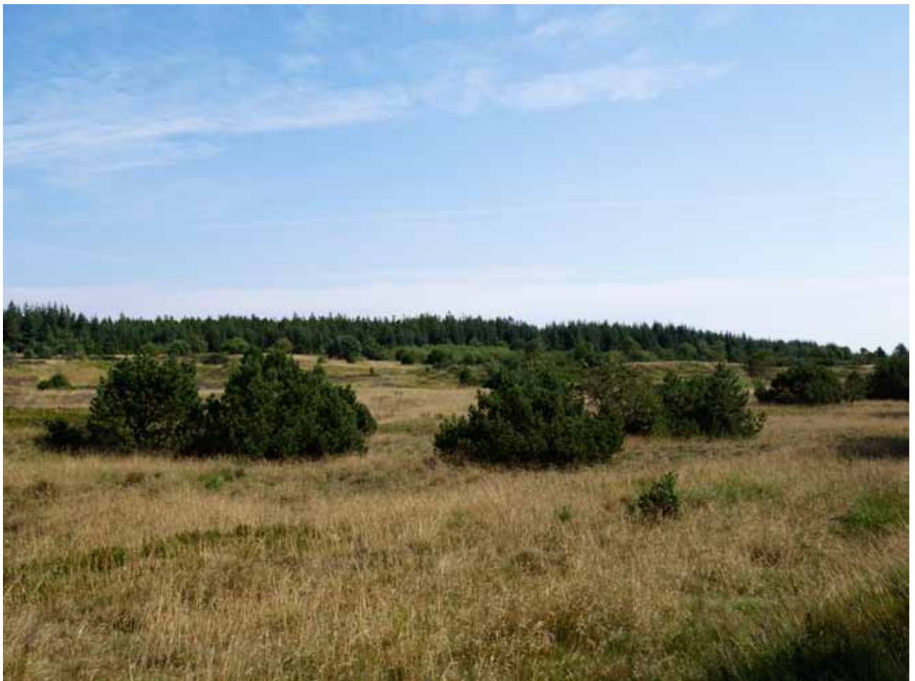
Landskab øst for Bonderup